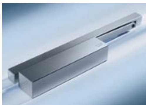
Ferme-porte TS 93 avec bras G-EMF

Conforme à la norme NF EN 1155. Pour porte à 1 vantail. Portes coupe-feu : oui. Couleur : argent (autre couleur nous consulter). Hauteur de la glissière : 30 mm. Alimentation 24 Volts (48 Volts nous consulter).