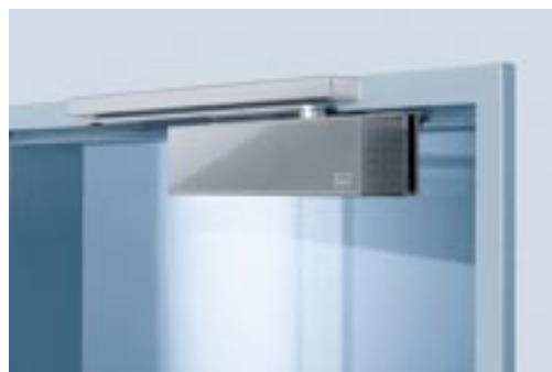
Ferme-porte TS 92

Conforme à la norme NF EN 1154. Marquage CE. Force de fermeture : EN 2-4. Pour porte intérieure ne donnant pas sur l'extérieur. Largeur de porte : 1100 mm maxi. Portes coupe-feu : oui. Force de fermeture réglable : oui par vis. Vitesse de fermeture réglable : oui par valve de 180° à 15°. A-coup final réglable : oui par valve. Freinage à l'ouverture : non. Retardement à la fermeture : non. Dimension en mm : L281 x P47 x H65. Couleur : argent (autre couleur nous consulter).