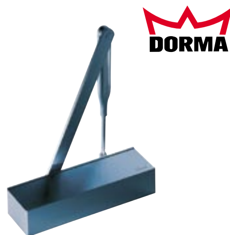
Ferme-porte TS 71

Conforme à la norme NF EN 1154. Marquage CE. Force de fermeture : EN 3-4. Pour porte intérieure ne donnant pas sur l'extérieur. Largeur de porte : 1100 mm maxi. Portes coupe-feu : oui. Force de fermeture réglable : oui en tournant la charnière du bras. Vitesse de fermeture réglable : oui par valve de 180° à 15°. A-coup final réglable : oui par la position du bras et hydraulique. Freinage à l'ouverture : non. Retardement à la fermeture : non. Dimension en mm : L232 x P45 x H68. Couleur : argent (autre couleur nous consulter).