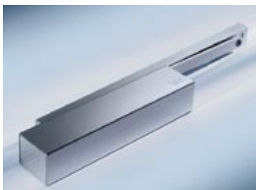
Ferme-porte TS 93

Conforme à la norme NF EN 1154. Marquage CE. Pour porte intérieure ou donnant sur l'extérieur. Largeur de porte : 1600 mm maxi. Portes coupe-feu : oui. Force de fermeture réglable : oui par vis. Vitesse de fermeture réglable : oui par valve de 180° à 7°. A-coup final réglable : oui. Freinage à l'ouverture : oui par valve. Retardement à la fermeture : oui. Dimension en mm : L285 x P62 x H71. Couleur : argent (autre couleur nous consulter).