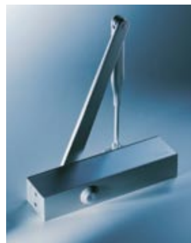
Ferme-porte TS 72

Conforme à la norme NF EN 1154. Marquage CE. Force de fermeture : EN 2-4. Pour porte intérieure ne donnant pas sur l'extérieur. Largeur de porte : 1100 mm maxi. Portes coupe-feu : oui. Force de fermeture réglable : oui en continu par vis. Vitesse de fermeture réglable : oui par valve de 180° à 15°. A-coup final réglable : oui par la position du bras et hydraulique. Freinage à l'ouverture : non. Retardement à la fermeture : non. Dimension en mm : L232 x P45 x H68. Couleur : argent (autre couleur nous consulter).