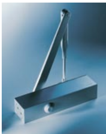
Ferme-porte TS 83

Conforme à la norme NF EN 1154. Marquage CE. Force de fermeture : EN 3-6. Pour porte intérieure ou donnant sur l'extérieur. Largeur de porte : 1400 mm maxi. Portes coupe-feu : oui. Force de fermeture réglable : oui en continu par vis. Vitesse de fermeture réglable : oui par valve de 180° à 13°. Freinage à l'ouverture : oui auto réglable et par valve. Retardement à la fermeture : oui sur version DC/SV. Dimension en mm : L245 x P46 x H60. Couleur : argent (autre couleur nous consulter).