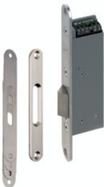
Gâche 351 avec contact à bille intégré sur la tête.