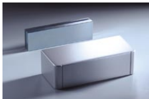
Ventouse TV 200