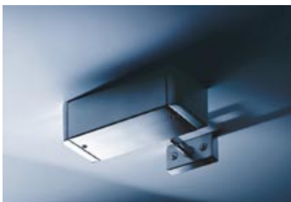
Verrou TV 100