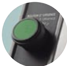
Ouverture par bouton d'urgence